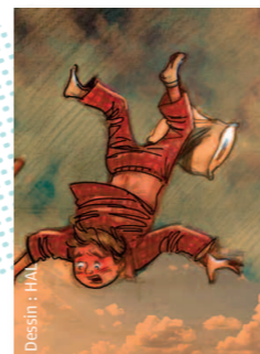
Dessin : HM

Une pièce sur la relation touchante entre une moman et son Louistiti de fils, faite de mots tordus, d'expressions succulentes et de beaucoup d'amour.