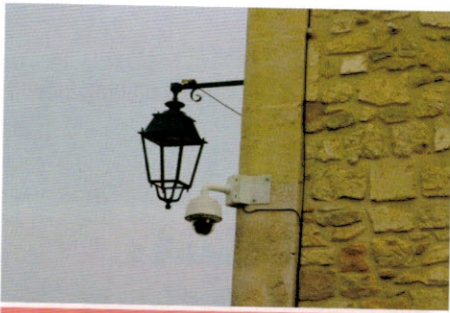
Installation de 10 caméras de vidéosurveillance