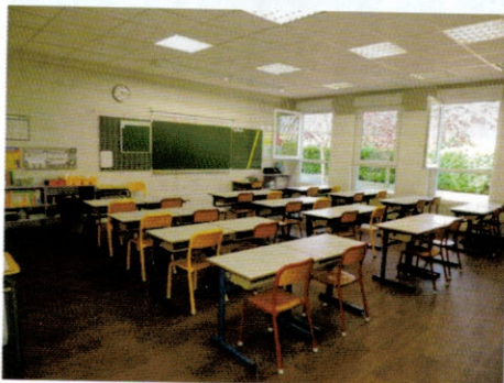
Réhabilitation des 2 Groupes scolaires Pergaud & Parc