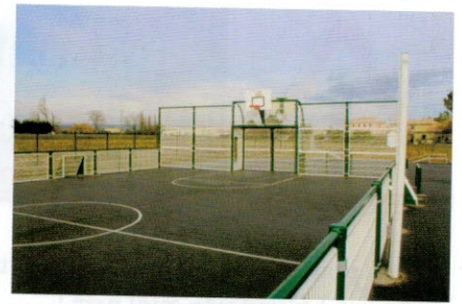
Création du City Park & du Skate Parc