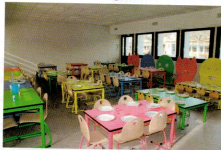
Création du restaurant scolaire du Parc avec le soutien financier de la CC RLP