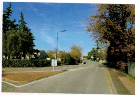
Montant des travaux de voirie réalisés en 2016