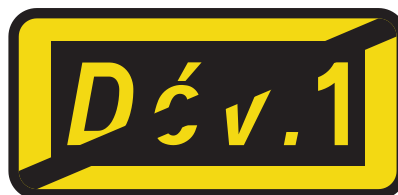
Exemple de panneau de fin de déviation avec le symbole "Dév."