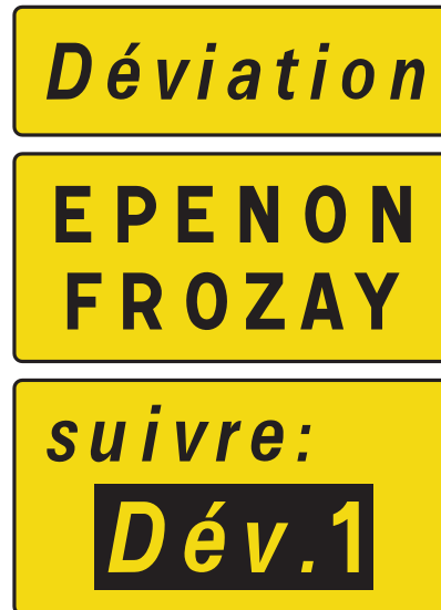
Exemple de panneau KD 79 avec le symbole "Dév." (signalisation au niveau du site d'entrée de la déviation)

Pour avoir plus d'informations sur le sujet, le lecteur pourra se reporter au guide Conception et mise en œuvre des déviations.