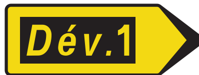
Exemple de panneau KD 22 avec le symbole "Dév." (signalisation de jalonnement)