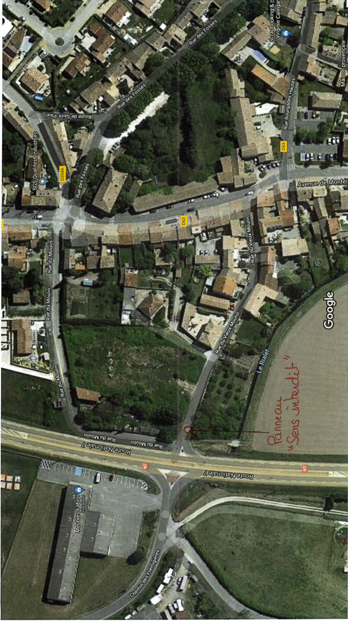
Images ©2021 Maxar Technologies, Données cartographiques ©2021 20 m