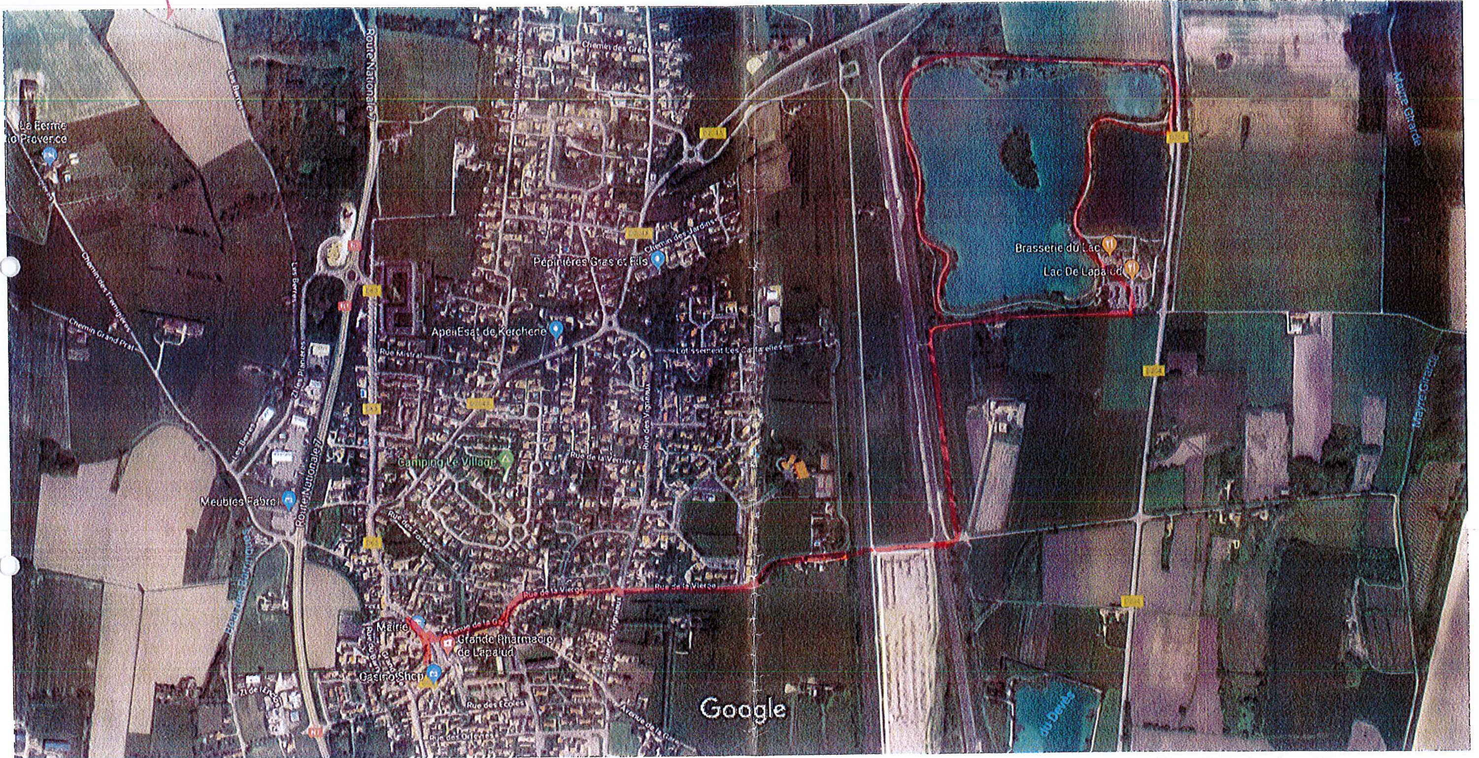
Images ©2018 DigitalGlobe, Google, Données cartographiques ©2018 Google 100 m